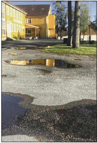
OMSTRIDT: Asfalteringen her, foran kommunehuset, starter til uka.